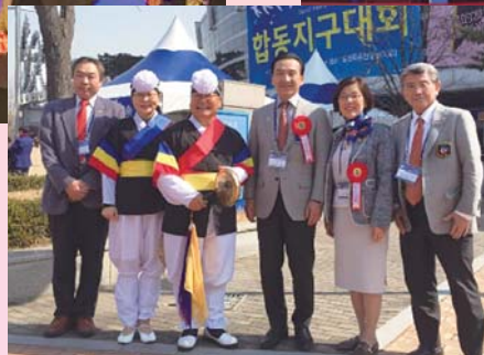
第3600地区ガバナーご夫妻と