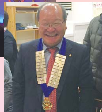
歴代ガバナー名を記したメダルを贈呈(大変喜んでいただきました)