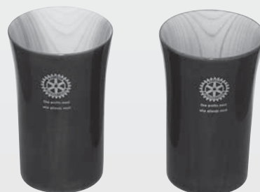
30年以上出席100%、在籍50年以上、90歳以上のロータリアンに贈られた春慶塗り“ビールグラス”

もう一度、当時の様な 憧れる 憧れられるロータリーになってほしいと願う、今日この頃です。